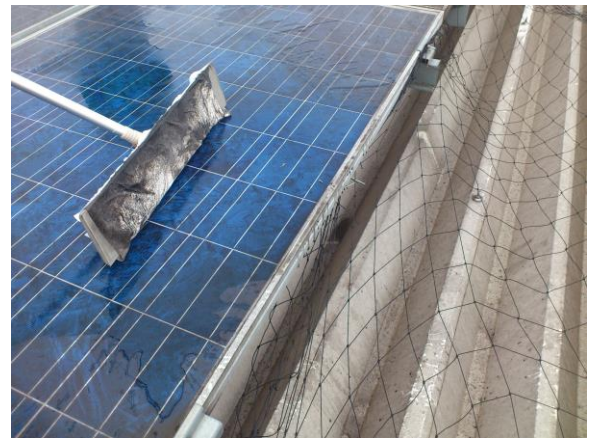
この汚れが発電を妨げます